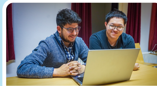
Computerkurs 17:00 Uhr