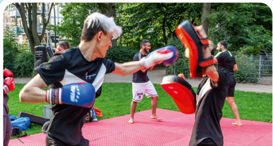
Thai-Boxen 18:00 Uhr