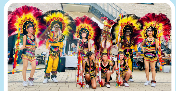
Folkloretänze (in Kooperation mit MALCA e.V.) 18:00 Uhr