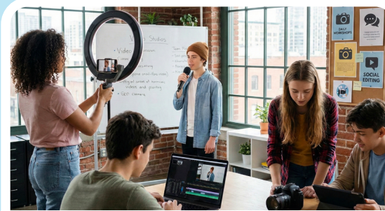
Content Creation Jeden 2. und 4. Mittwoch im Monat 17:00 Uhr