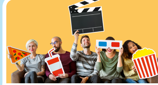
Movie-Night in der Bücherhalle Altona Jeden 1. Donnerstag im Monat 17:00 Uhr