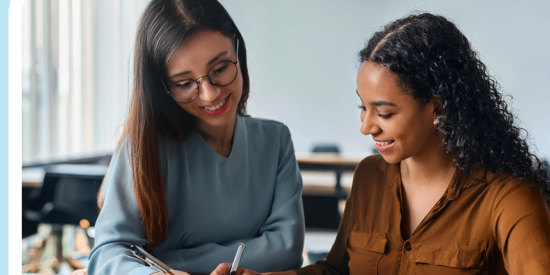
Ausbildungs- und Berufsberatung ab 17:00 Uhr nur mit Termin