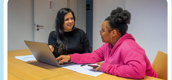
Sozialberatung ab 16:00 Uhr nur mit Termin