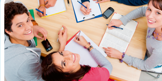
Nachhilfe ab 16:00 Uhr nur mit Termin