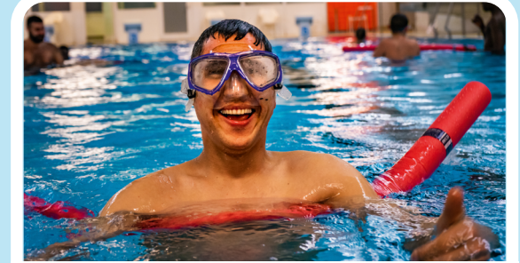
Schwimmkurs für Anfänger*innen 20:00 Uhr