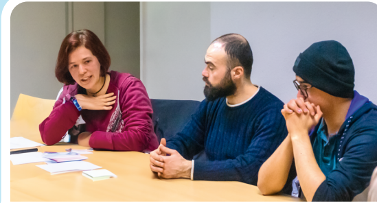
Sprachcafé auf Deutsch 17:00 Uhr