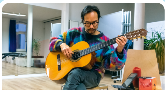
Gitarrenkurs 17:00 Uhr