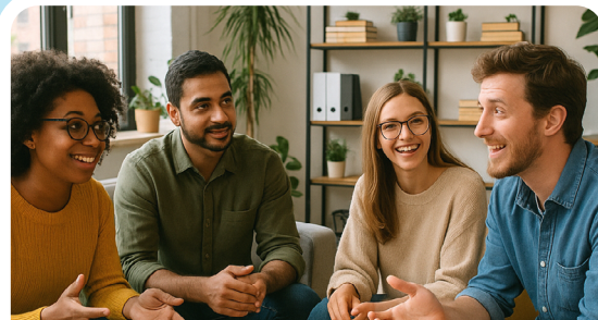
Sprich mit! – Deutsch für Einsteiger*innen Jeden 2. und 4. Dienstag im Monat 17:00 Uhr